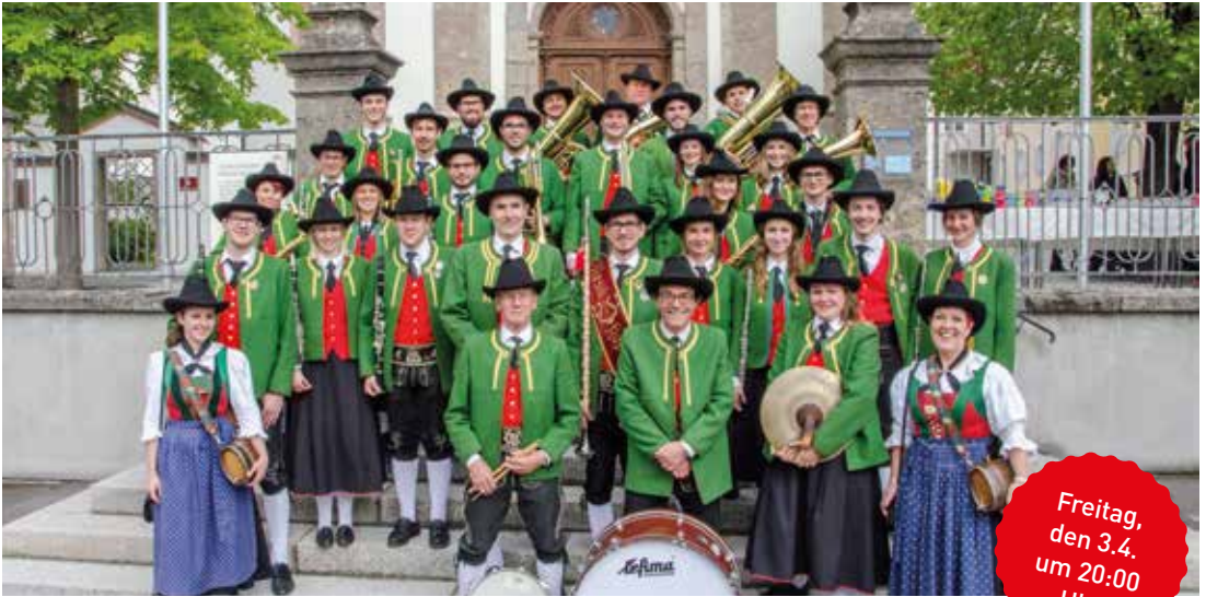
Stadtmusikkapelle Mariahilf-St Nikolaus im Canisianum Eintritt: Freiwillige Spenden