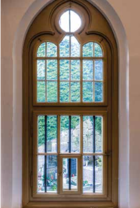
Fensterblick - neues Büro St. Nikolaus