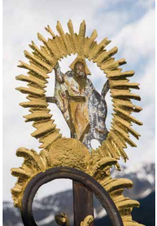
Grab mit Auferstandenem - Friedhof St. Nikolaus

letzte Gespräche, die sich wie ein Testament eingepägt haben. Letzte Atemzüge werden zum Ausatmen und Aufatmen. Und dennoch bleibt es nicht still um uns Zurückbleibende: Lieder kommen in den Sinn und ihre Melodie tragen durch Stunden und Tage der Trauer. Kirchenlieder wie Schuberts „Wohin soll ich mich wenden“ ist vielen von Kindheit an vertraut, sein „Heilig, heilig, heilig“ richtet auf. Wer die Trauermette von Sankt Nikolaus kennt, taucht ein in den wiederkehrenden Ruf „Jerusalem, Jerusalem, kehre heim zum Herrn, deinen Gott.“ Und Liedermacher wie von Goisern holt mit „Weit, weit weg von hier“ unsere Lieben tief ins Herz zurück.