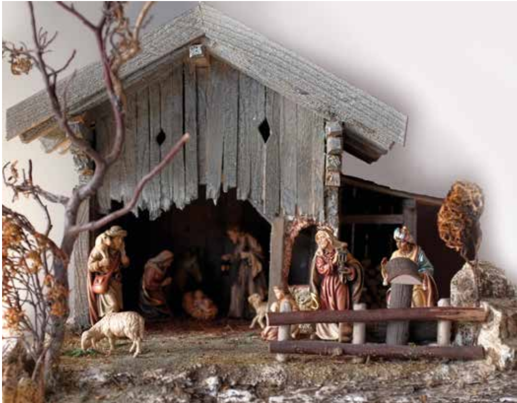
Diese Krippe von Viola Renzler ist im Zuge eines Kinder Krippenbau Kurses entstanden.