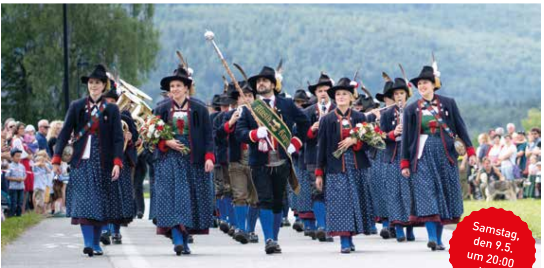
Stadtmusikkapelle Hötting im Mehrzwecksaal Hötting Eintritt: Freiwillige Spenden