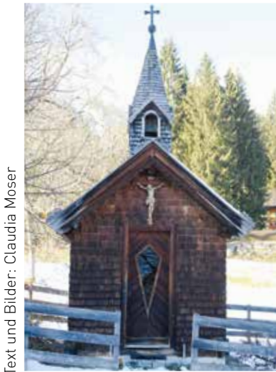
Text und Bilder: Claudia Moser