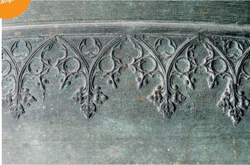
Glockendetail St. Nikolaus

Jahr der Erprobung neu justiert wird, damit sich keine unnötigen Missklänge einschleichen. Eine Kirche sind wir, die immer neu konkret wird: sichtbar in unseren Gotteshäusern, hörbar in ihrer Botschaft. Dafür erklingen unsere Glocken und nicht nur zum Stundenschlag oder Zusammenläuten zum Gottesdienst. Sie verkünden die zentralen christlichen Botschaften: Dreimal am Tag das Angelus-Läuten – der Engelsgruß: Gott ist mit dir, fürchte dich nicht! Freitag nachmittags um Drei – memento mori: Jesus stirbt am Kreuz, gedenke, dass du sterblich bist. Jesus lebt – mit ihm auch ich - das Gloria-Läuten in der Osternacht. Unsere Kirchen sind Botschafterinnen der Auferstehung zum ewigen Leben. All unseren Empfindungen von Geburt bis zum Grabe möchten unsere Glocken einen Klang verleihen: unserer Freude und unserm Weinen, unserem Dank und unserer Bitte. Das Glockengeläut trägt uns über uns selbst hin-