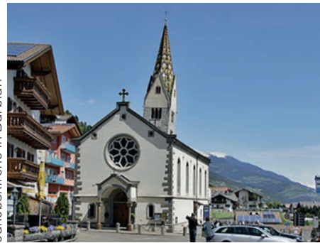
Jakobskirche in Barbian