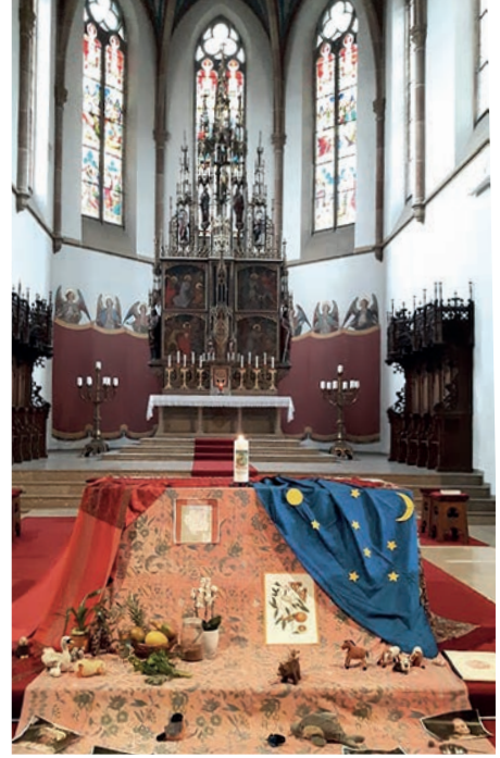
Altar in der Kirche St. Nikolaus