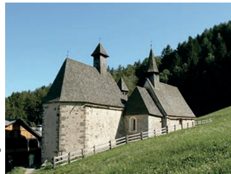
Drei gotischen Kirchlein