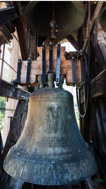
Im Höttinger Glockenstuhl

Wie gut den drei Pfarren das gelingt, ist uns ganz lebendig in Erinnerung: Ein prächtiges Klangbild von hohen und tiefen Tonlagen hinterließen die Sänger und Musiker unserer Stadtteile Hötting, Hungerburg und St. Nikolaus beim Mariensingen in St. Nikolaus! Von selbst geschieht das nicht. Wir beraten und brüten aus, rufen und raufen uns zusammen, damit es für möglichst alle passt. Das gemeinsame Logo mit je eigenem neuen Pfarrlogo ist die Frucht solcher Arbeit unserer Pfarrgemeinderäte genauso wie die gemeinsame Firmvorbereitung und eine Gottesdienstordnung, woran jetzt nach dem ersten