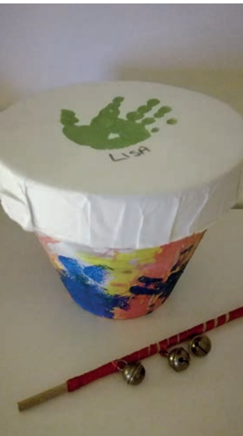
DIY Trommel für Kinder